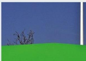
Orizzonte Una delle foto di Paolo Coltro

I fotografi propongono al pubblico il proprio punto di vista, specifiche porzioni emotive visive, attratti ora da storie sfumate, ora da larghe campiture cromatiche. Sempre alla ricerca di quell'altrove di senso dove, la buona fotografia, sa traghettare lo sguardo. Così Mario Dal Molin, istituzione storica del Fotoclub padovano, ci trasferisce a Parigi in