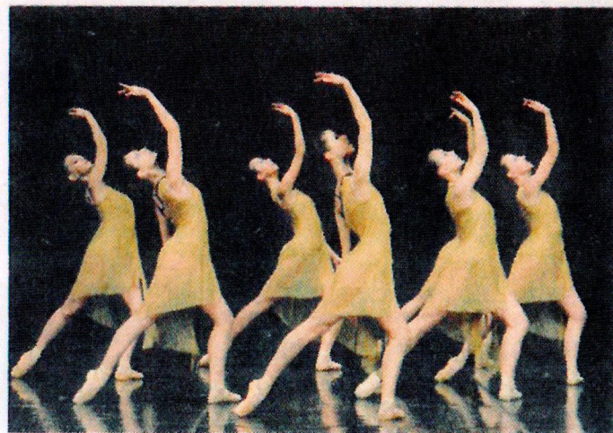
Un balletto degli studenti della scuola della Scala di Milano